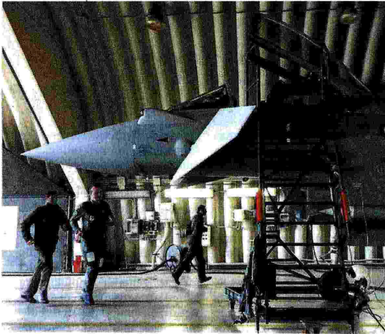
Super caccia. Sviluppato in collaborazione tra Italia, Uk, Germania e Spagna, l'Eurofighter Typhoon è il più avanzato caccia multiruolo disponibile sul mercato. Leonardo partecipa al programma con le divisioni “velivoli” ed “elettronica”