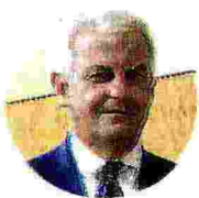
ALESSANDRO PROFUMO Amministratore delegato di Leonardo

Oggi i 22 fornitori selezionati da Leonardo per il programma Elite fatturano 360 milioni di euro