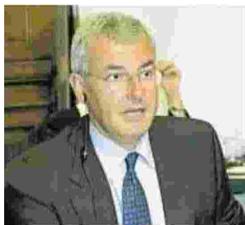
Ad Alessandro Profumo, ad di Leonardo

Il manager: "Quando arriva il termine vedremo cosa è successo, ci sono riflessioni da fare"